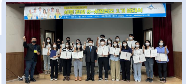
세종 관광 S서포터즈