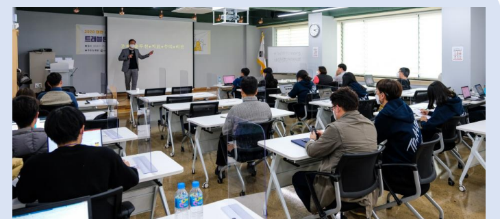
지역 관광인재 육성 아카데미