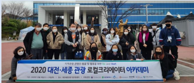
로컬 크리에이터 양성사업