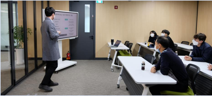
대전세종 산학연계 일자리 지원 사업